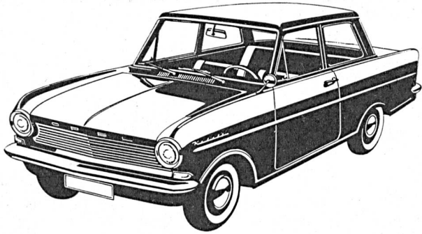
Der rassige, sparsame Kadett 5 PS