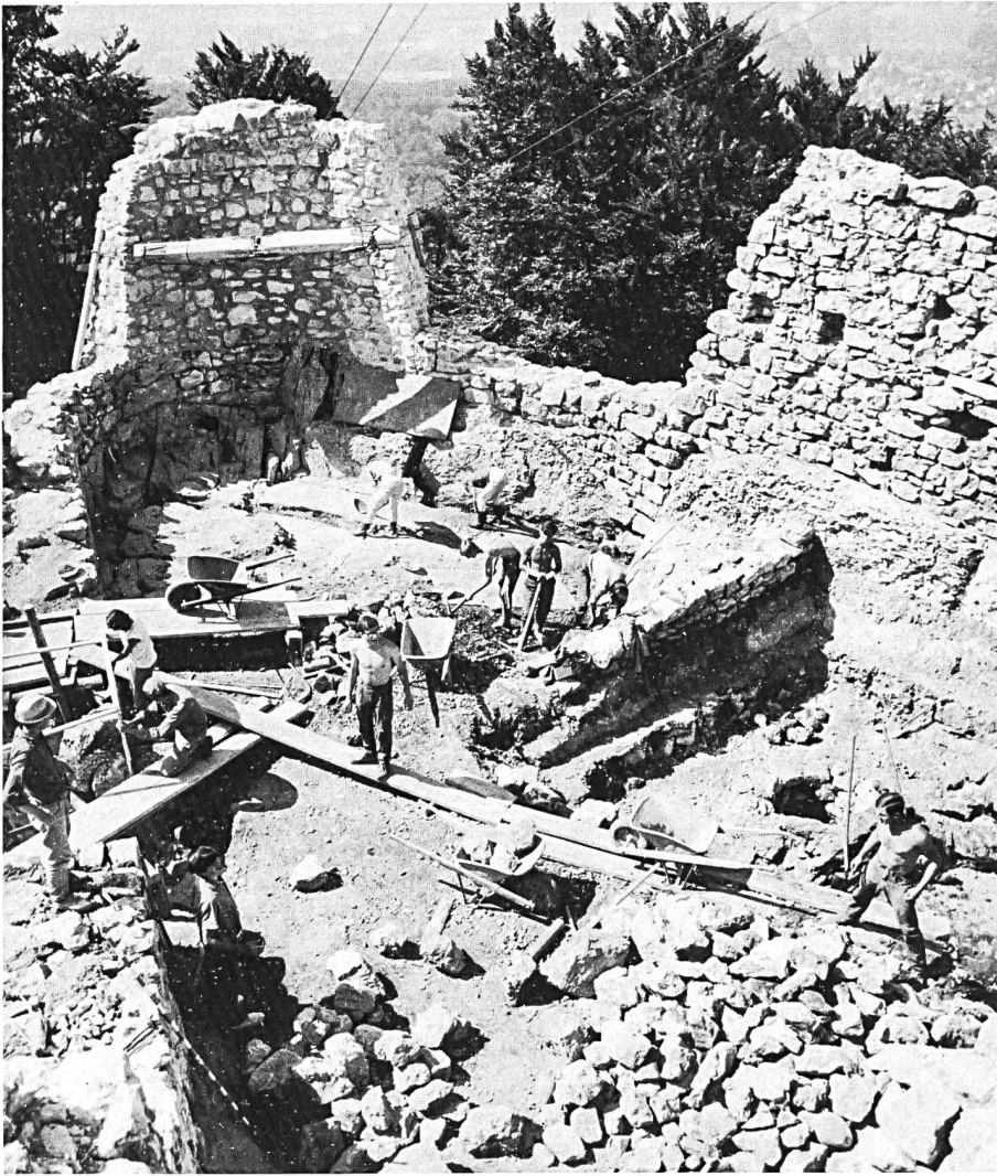
Oben: Ruine Alt-Wartburg, Blick von Nord nach Süd. Südlicher Bering gegen Ende der Ausgrabung. In der Mitte des linken Bildrandes befindet sich das Burgtor. In der rechten Hälfte ist die Zisterne mit dem Schöpfschacht bereits gut ersichtlich.