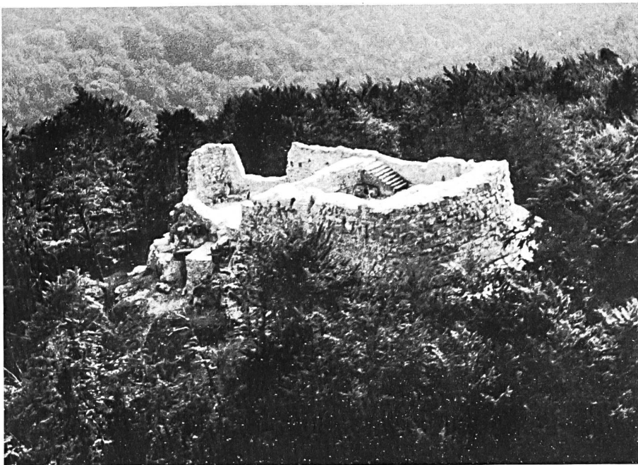
Unten: Ruine Alt-Wartburg, Blick von Nord-Ost. Rechte Hälfte ehemaliger Wohnturm mit Kellertreppe; linke Hälfte = südlicher Bering mit Burgtor und Brücke. Zugang über Felsweg. Der Wohnturm dürfte 5 Geschosse, der südliche Bering deren 2 umfassen haben. Gesamtlänge der Burg 40 Meter, Breite 10 Meter.

fand sich ein Schöpfschacht von 1 Meter Durchmesser, in welchem sich das filtrierte Wasser sammelte. Wände und Boden des Beckens waren mit einer wasserfesten Lehmschicht abgedichtet. Der wasserfeste Zusatz weist eine rötliche Färbung auf. Leider kennt man heute diesen Zusatz nicht mehr, und chemische Untersuchungen sollen hier wenn möglich Aufschlüsse vermitteln.