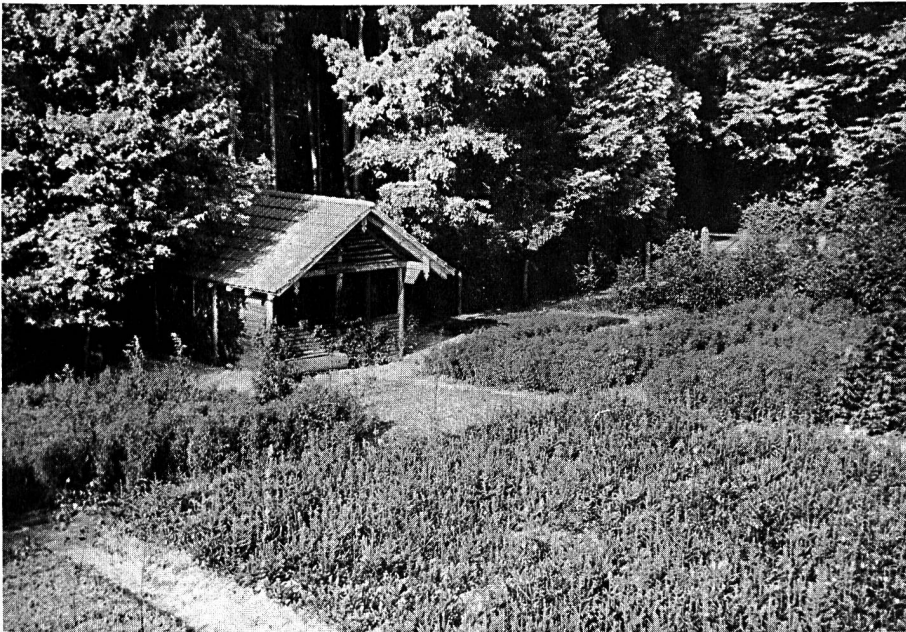
Der Forstgarten im Längacker liefert praktisch alle Pflanzen, die im Säliwald benötigt werden.

gungsfeld. Jeder Forstbetrieb ist mit seinem Personal einer Familie gleich, die unter Aufsicht der Gemeindebehörden, Kreisoberförster und kantonalen Forstbehörden ein grosses Landschaftsgebiet bearbeitet, bewirtschaftet und hegt und pflegt. Wenn auch Wert und Bedeutung des Waldes und die Arbeit des Forstpersonals von gewissen Leuten belächelt werden, steht heute einwandfrei fest, dass der Wald wirtschaftlich und sozial ein unermessliches Vermögen darstellt. Solche Leute sind im Geiste bereits der Kultursteppenkrankheit erlegen und haben die Beziehung zur Mutter Erde verloren. Wirtschaftliche Gesichtspunkte, wie Nutz- und Brennholzproduktion und da-