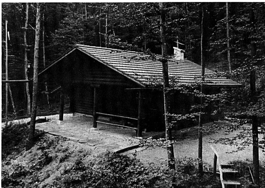
Die Waldhütten der Forstverwaltungen bieten nebst ihrem forstlichen Zweck auch den Spaziergängern Schutz vor Regen oder dienen zum gemütlichen Rasthalt. Bitte Ordnung halten!

Der Wald ist für viele Erholungssuchende ein scheinbar unerschöpflicher Wohlfahrtsspendender. Entsprechend dieser Meinung verhalten sich auch viele Waldgänger. Unsere Wälder sind mit ihrer abwechslungsreichen Vielfalt an Schönheiten und Geheimnissen wirkliche Oasen der Ruhe, sofern wir uns entsprechend benehmen. Die ständig anwachsende Bevölkerung hat bereits vielerorts zu einer totalen Besiedelung und Verstädterung geführt. Der Wald ist zum beliebten und billigen Ausflugsziel, aber oft auch direkt zum Rummelplatz des Volkes geworden. Diese beängstigende, vom Forstmann aus gesehen, unheilvolle Entwicklung für den Wald, sofern wir sie nicht rechtzeitig in den Griff bekommen, bedingt eine Verhaltensänderung vieler Benutzer des stadtnahen Erholungswaldes. Denken wir einmal zurück an unsere Jugendzeit in mehr oder weniger ländlichem Gebiet. Unser grosser Spielplatz, Erforschungsraum und oft auch Arbeitsplatz war der geheimnisvolle Wald. Wir waren weder beim Spiel noch in der Nutzung im Wald immer rücksichtsvoll, nein — oft sogar recht rauh. Der Unterschied liegt aber heute darin, dass wir damals 10 Waldbewohner waren und jetzt sind es deren 100 oder das