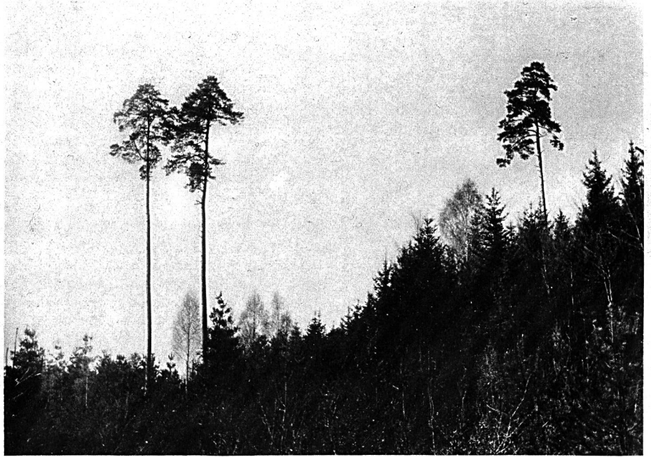
Altholzföhren auf Jungbeständen im Glashüttenwald. Der Anblick dieses Waldbildes freut uns im heutigen Betonzeitalter besonders.

Pflichtbewusstsein, Freiheit und Selbständigkeit kennzeichnen den Försterberuf und bilden mit einer gehörigen Portion Liebe und Freude zur Natur eine wirklich ideale Arbeitsgrundlage, wie sie nur in wenigen Berufen zu finden ist. Wer für Reichtum und materielle Werte lebt, der ist dem Wald ein schlechter Diener und scheidet früher oder später aus. Der Wald mit seiner reichhaltigen Lebewelt wird vom Förster als Betriebsleiter weitgehend beeinflusst, so dass das Landschaftsbild des Waldes, die Produktion, der Gesundheitszustand und der rein äusserliche Eindruck dem aufmerksamen Beobachter ein unterschiedliches Bild zeigen. Mangelhafte Betreuung und schlechte Behandlung können sich sehr nachteilig und gefährlich auswirken. Nachhaltige, naturgemässe Bewirtschaftung, gute Betriebsführung, intensive Waldpflege, Waldstrassenbau, schonende Landschaftspflege und Naturschutz bieten dem Förster mit seinem Personal ein reichhaltiges Betäti-