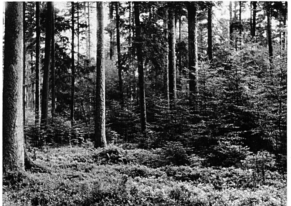
Tannen/Fichtenbestand mit reichlicher Naturverjüngung im Glashüttenwald. Der naturnahe Zustand dieses schönen Waldes bietet biologisch günstige Verhältnisse für Pflanzen und Tiere. Er ist für Pilz- und Beerensammler wie für Spaziergänger ein bevorzugtes Gebiet.

zeugnis an eine öffentliche höhere Forstbeamtenung und das eidgenössische Diplom als Forstingenieur ETH. Vor einer definitiven Wahl als Oberförster erfolgt in der Regel eine weitere Praxiszeit als Adjunkt, freierwerbender Forstingenieur, als forstwissenschaftlicher Mitarbeiter, Auslandsaufenthalte usw. Der Forstingenieurberuf wird zu Recht von vielen als einer der idealsten Berufe bezeichnet. Eine hervorragende Ausbildung, die verantwortungsvolle und vielseitige Arbeit und der Wald als Arbeits-