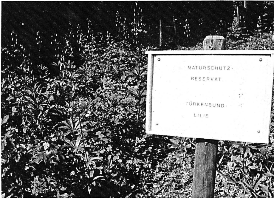
Naturschutzreservat der Forstverwaltung Aarburg, im Säliwald.