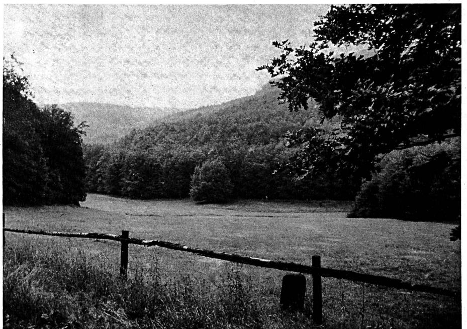
Waldwiesen und natürliche Waldsäume bieten der Tierwelt des Waldes günstige Lebensbedingungen. Bei Dämmerung und in der Nacht tritt das Wild hier zur Äsung aus. Waldsaumzonen werden durch die Vögel am dichtesten besiedelt.

In kurzen Zügen sei hier die Ausbildung des Forstpersonals umschrieben, wie sie heute in der Schweiz allgemein Anwendung findet. Da auch die Bäume von unten nach oben wachsen und nicht umgekehrt, erfolgt die Reihenfolge der Beschreibung ebenfalls in diesem Sinn und nicht nach standesmässigen oder finanziellen Gesichtspunkten.