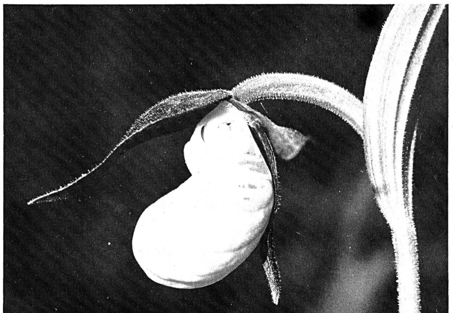
Frauschuh — ein Kunstwerk der Natur. Diese Orchideenart ist in unseren Wäldern nur noch ganz selten und unter strengem Schutz. Ist sie eine der nächsten Pflanzen, die bei uns ausstirbt?

Der Wald unserer dichtbesiedelten Landschaft ist zum wichtigen Punkt einer ganzheitlichen Lebensgemeinschaft geworden. Die naturbedingte Funktionsfähigkeit des Waldes bleibt ewig erhalten, wenn wir alle nun einmal notwendigen Eingriffe in das Naturgeschehen biologisch sinnvoll und schonend gestalten und uns selber in diese Gemeinschaft einfügen, nicht zuletzt im eigenen Interesse. Der Wald mit seiner Vielfalt und seinem Reichtum bietet uns körperliche und geistige Erfrischung, Ruhe und Geborgenheit. Er ist zum klassischen Gesundheitsraum geworden. Unseren Wald uneingeschränkt zu erhalten, geht uns alle an, nur so können wir ihn stets neu erleben.