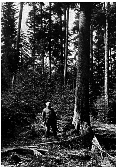
150jähriger Tannen/Fichtenbestand im Glashüttenwald. Die Natur sorgt mit dem dauernden Samenflug für Verjüngung dieser Altbestände.

Vorbedingung für die Aufnahme an einer Försterschule ist die abgeschlossene Lehrzeit als Forstwart, eine mindestens zweijährige Weiterbildung und die bestandene Aufnahmeprüfung. Eine einjährige intensive Ausbildung auf allen Fachgebieten des Waldes, der Forstwirtschaft und des forstlichen Bauwesens vermitteln dem Forstschüler das Rüstzeug und die Grundlagen für den vielseitigen und abwechslungsreichen Försterberuf. Die den Wald und damit auch den Förster unmittelbar tangierenden Nachbargebiete, Wildhege und Jagdwesen, Naturschutz, der