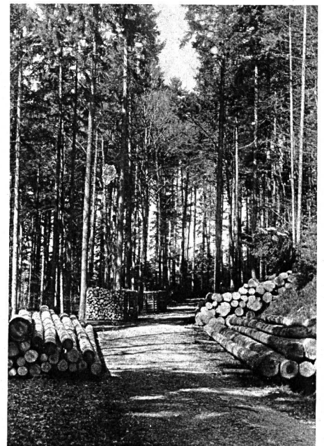
Der messbare Wert des Waldes ist der Ertragswert durch die Holzproduktion. Der ideale Wert als Wohlfahrtswirkung, als Sauerstoff- und Wasserlieferant und als Reservat für Tiere und Pflanzen ist nicht weniger gross.

Gebieten ist der Wald heute oft mehr Reservat für Pflanzen und Tiere als Lieferant von Holz und Erträgen. Diese Entwicklung bringt auch dem Förster viel neue und oft kaum lösbare Aufgaben. Verschmutzung, Zerstörungen und Schäden aller Art im Wald nehmen in beängstigender Masse zu und drängen nicht selten zu strengen Massnahmen. Heute ist es noch Zeit, dieser Gefahr wirksam entgegenzutreten, aber wir alle müssen handeln. Es beginnt jetzt eine gemeinsame Aufgabe, da sie der Förster mit seinem Personal nicht mehr allein bewältigen kann.