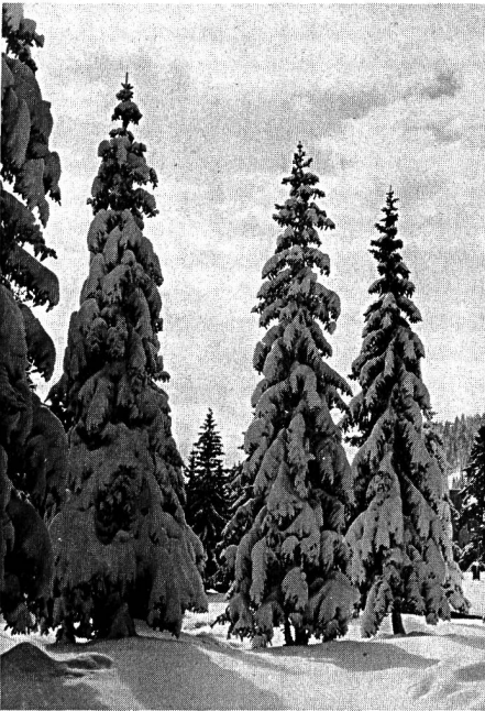
Ein Spaziergang im winterlichen Tannenwald ist gesund und bietet Gelegenheit für besinnliche Stunden, Erholung und Ruhe.