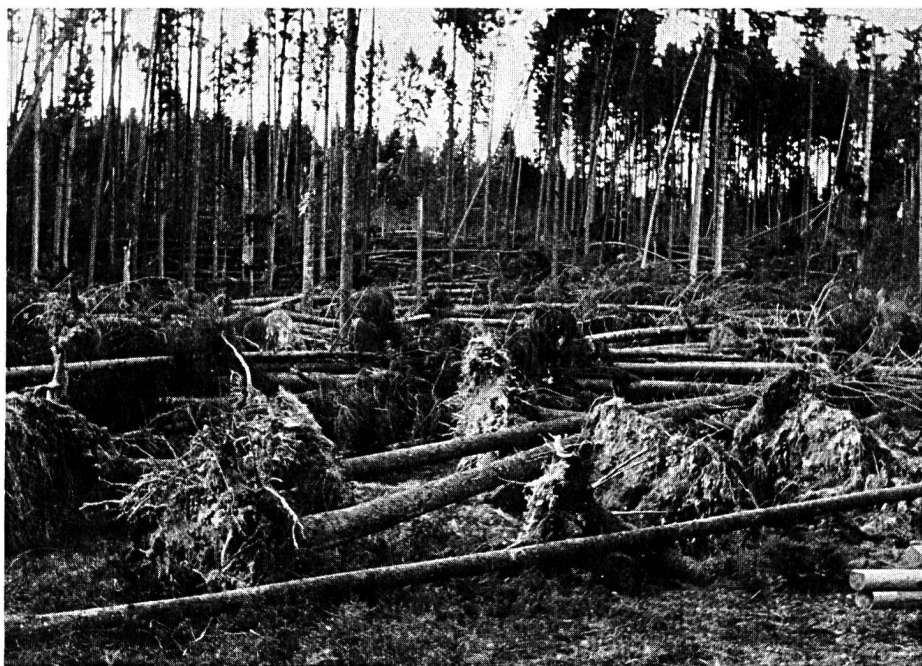
Flächen-Windwurf 1967 im Langholzwald.