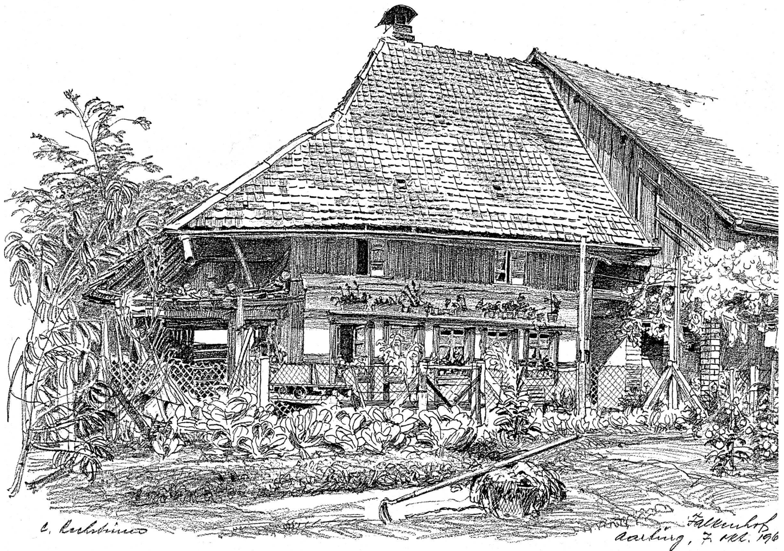
Der Falkenhof in Aarburg, 1964

Wir sind glücklich, hier drei seiner Zeichnungen zeigen zu können.