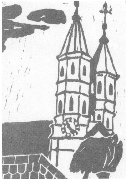
Linolschnitte aus der Zeichenklasse der 4. Bezirksschule Aarburg