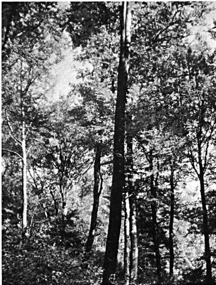
150jähriger Jura-Buchenwald in Naturverjüngung.