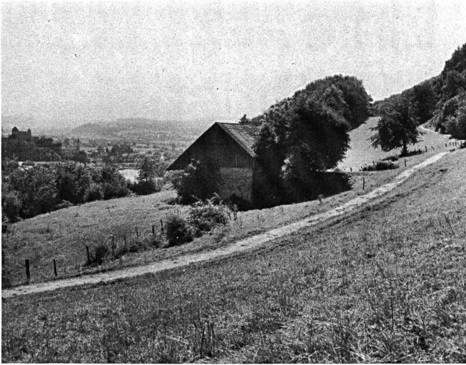
Neuer Wanderweg: Blick gegen Süden...