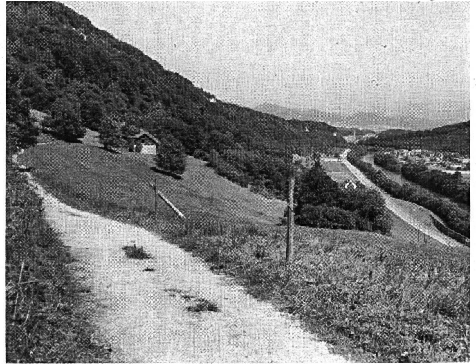
... Blick gegen die Kloos