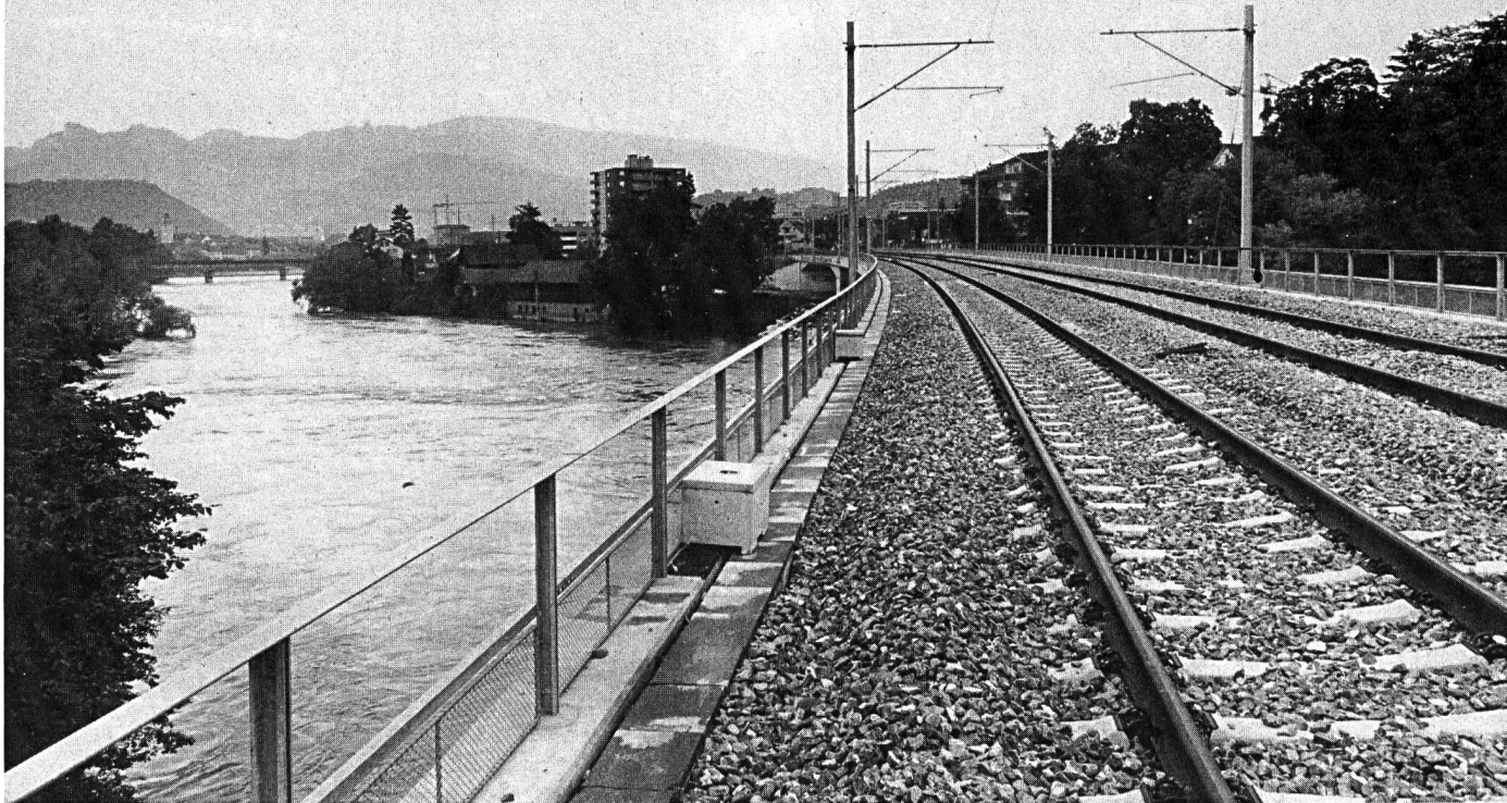
Brücke in der Kloos.