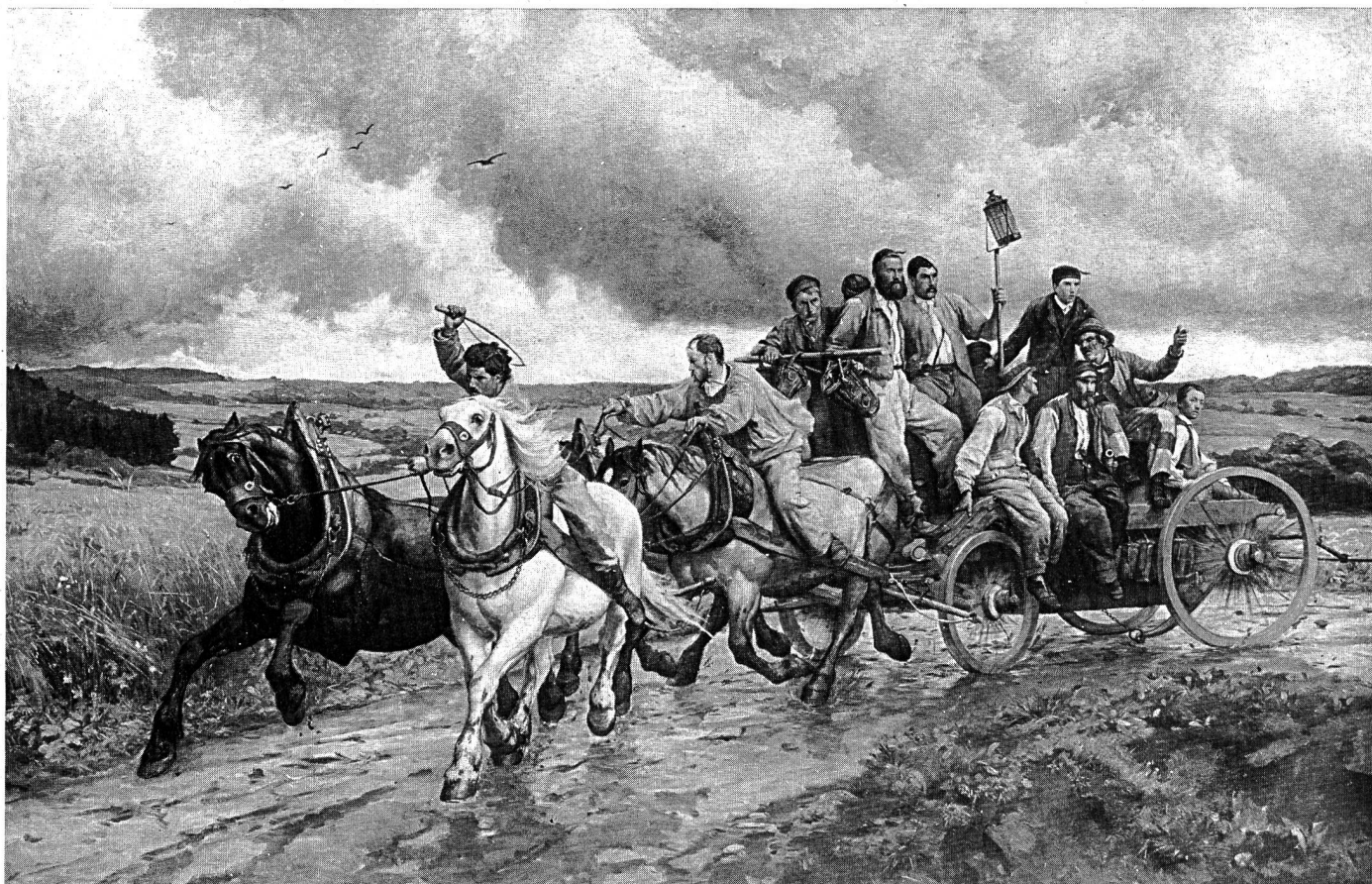
Gott zur Ehr - dem nächsten zur Wehr 150 Jahre nach dem Stadtbrand von 1840 4. Mai 1990 • Stadtfeuerwehr Zofingen