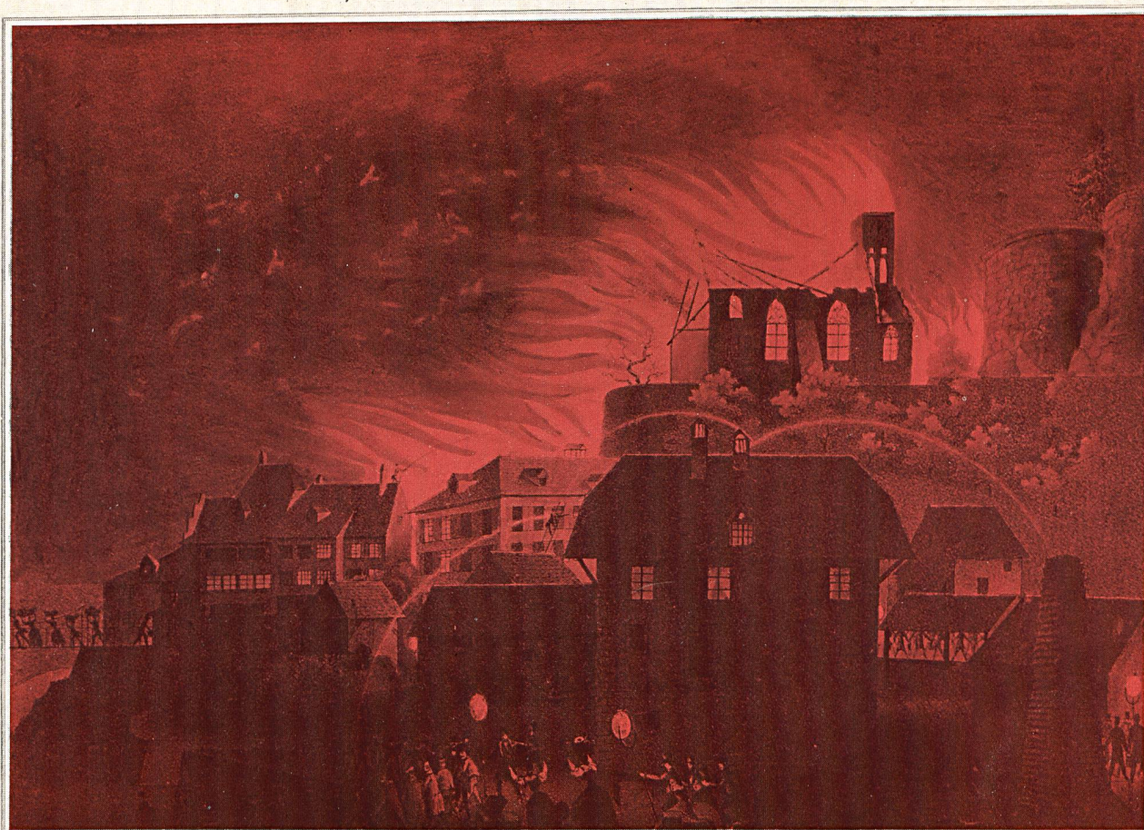
ARBURG den 3 ten Maj 1840.

In der Rathaushalle Aarburg versammelten sich am 4. Mai 1990 eingeladene Gäste zu einem schlichten Gedenkanlass «150 Jahre nach dem Stadtbrand von 1840».