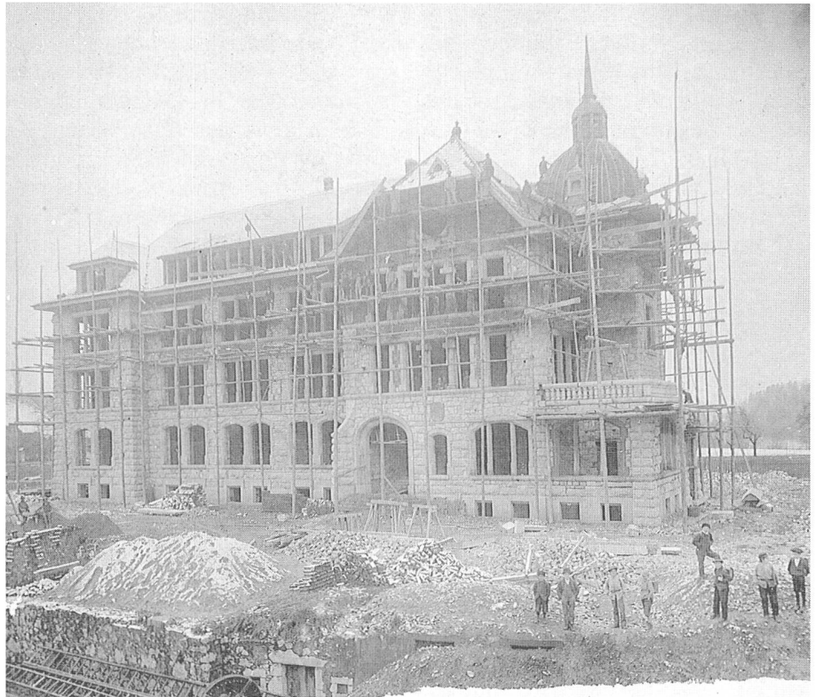
Das Gemeindeschulhaus während des Baus im Winter 1902/03. Im Vordergrund die zugeschüttete Parterrewohnung des alten Herrenspittels.

«In einem früheren Bericht haben wir bemerkt, dass der Raum in mehreren Gemeindeschullokalen, insbesondere bei den Mittelschulen, wahre Kalamitäten hervorruft. Dazu kommt, dass die Schülerzahl allein im letzten Jahre um 22 = ca. 12% zugenommen hat. Es ist kaum anzunehmen, dass diese Zahlen in Zukunft sinken werden. Nun ist einer der Mittelschullehrer genötigt, selbst wenn an 4-Plätzertischen 5 Kinder gesetzt werden, Pult und Schrank aus dem Schulzimmer zu entfernen, damit die Schüler Platz finden. Und die zuvorderst sitzenden Schüler können von ihrem Platze aus mit den Händen die vor ihnen stehende Wand erreichen. In der anderen Mittelschule sind die Verhältnisse um nichts besser. Ein Fortbestehen solcher gesetzwidriger, den Unterricht und die Gesundheit der Schüler