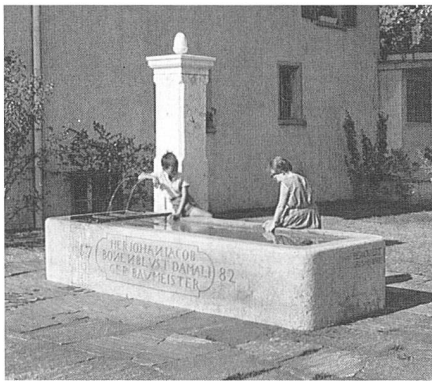
Der ehemalige Vorstadtbrunnen, der renoviert und neben der Migros aufgestellt wurde.

Besonders arg müssen die Verhältnisse im Sommer 1893 gewesen sein; so wird dazu berichtet, der Stadtbrunnen habe längere Zeit nur spärlich Wasser geliefert, während der Vorstadtbrunnen völlig abgestanden sei. Man musste sich mit Notbrunnen behelfen und zwar in der Weise, dass im Gebiete der Landhäuser, an der Aare, der dort in reichlicher Masse zu Tage tretende «Hägeler» gefasst wurde. Die Trockenheit wirkte sich auch anderweitig nachteilig aus: in den auf Wasser-