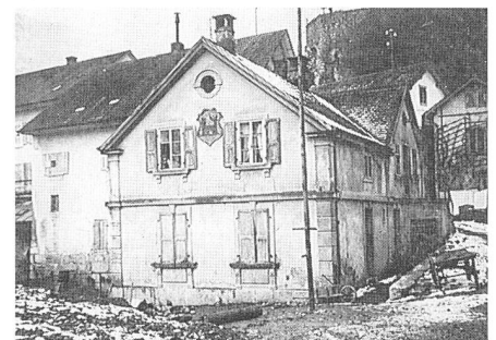
Der ehemalige Polizeiposten auf dem Centralplatz, abgebrochen 1916/17. Heute Arztpraxis Dr. Haller.

Die Einführung der mitteleuropäischen Zeit brachte für die Schulen etwelche Unannehmlichkeiten. Für die Monate Dezember und Januar, also in den kürzesten Tagen, konnte den Anforderungen des Lehrplanes betreffend die Zahl der Unterrichtsstunden nicht anders genügt werden, als dass man diese um einige Minuten kürzte. Dagegen mag die nun etwas längere Mittagspause für die Schüler in gesundheitlicher Hinsicht von Vorteil gewesen sein und namentlich den auswärts wohnenden Schülern gedient haben.