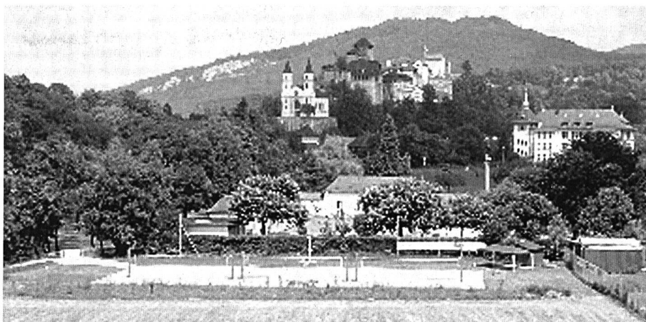
Die Beachvolleyball-Anlage hinter der Badi.

Die Technik im Filtergebäude: Pumpen mit Baujahr 1957, Gussleitungen, die elektrischen Anlagen (Tableau), der Sandfilter, Chlorgasanlage, etc., sind veraltet und sollten dem heutigen Stand der Technik angepasst werden. Nach den gültigen SIA-Normen 385/1 müsste die Wasserumwälzung um den Faktor 3,7 erweitert werden. Gleich-