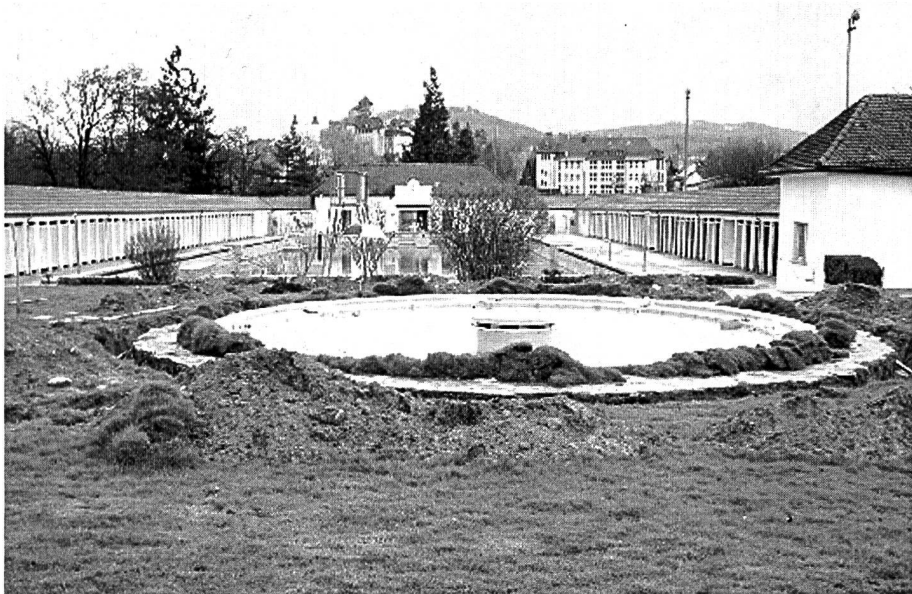
Auswechslung der Ringleitung um das Kinderbassin im Frühjahr 2001.

Inzwischen ist die Nostalgiebadi durch die mit grossem Kostenaufwand erstellten Freibadanlagen in Olten und Zofingen und durch das vor ca. 30 Jahren eröffnete Hallen- und Freibad in Rothrist stark konkurrenziert. Nachteile wie unbeheiztes Wasser, die fehlende Abgrenzung der Zone für Schwimmer und der Sprunganlage und der veralteten Infrastrukturen können mit der einzigartigen Lage an der Aare nicht aufgewogen werden. Für die dringend notwendigen Sanierungen fehlen die Mittel.