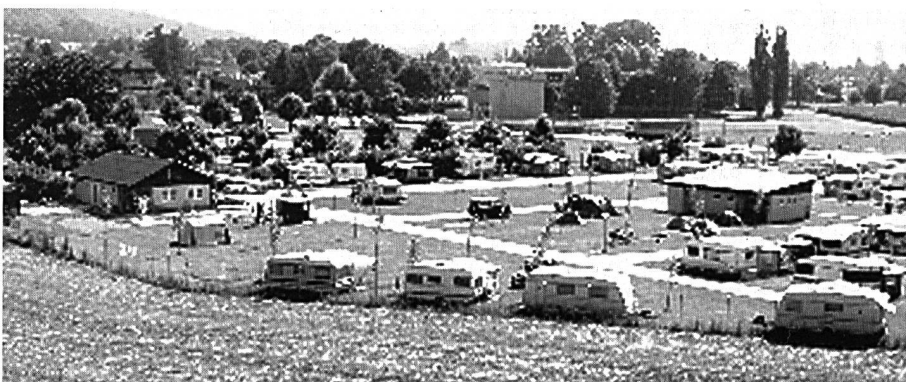
Der im Jahr 2000 neu erstellte Camping-Platz neben der Badi.

zeitig ist ein Ausgleichsbecken für die Oberflächenwasserumwälzung zu erstellen. Sobald die neue SIA-Verordnung in Kraft tritt, wird es eine Frage der Zeit sein, bis entsprechende Massnahmen verfügt werden.