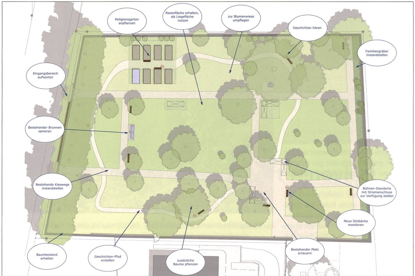
Plan der Umgestaltung und Belebung des Alten Friedhofs.

Ausweitung der Ausstattungen wurde bewusst verzichtet, um dem Ort seine Grosszügigkeit und seine Ruhe zu belassen. Die noch vorhandene zentrale Baumgruppe bildet eine räumliche Mitte. Durch diese Bündelung lassen sich weitere Flächen freispielen, welche individuell nutzbar bleiben. Sie können temporär mit Bestuhlung, Zelten, Ständen, Bühnen oder Ähnlichem bestückt werden. Verschiedene Bühnenstandorte für Konzerte, Lesungen oder andere Aufführungen wurden definiert und entsprechend vorbereitet. Die vier Torsäulen der beiden Eingänge haben wieder einen figürlichen Schmuck erhalten. Mit all den umgesetzten Ideen und Massnahmen erhält Aarburg auf das Jahresende 2021 einen einladenden Park mit bewegter Geschichte. Im Frühjahr 2022 wird ihn die Gemeinde mit einem Fest einweihen. Alle Einwohnerinnen und Einwohner sind eingeladen, den einstigen Ort der Stille zu besuchen und seine Kraft zu spüren. Eine weitere Perle inmitten belebter Quartiere lädt zum Verweilen in naturnaher Umgebung ein.