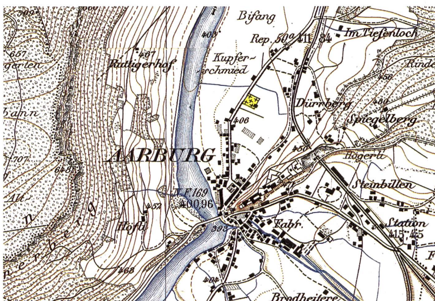
Ausschnitt aus der Siegfriedkarte von 1884. Der Friedhof an der Oltnenstrasse ist bereits eingezeichnet.

Der Alte Friedhof wurde rund 85 Jahre lang betrieben und gemäss glaubwürdigen Berichten wurden bis zu drei Bestattungen an derselben Stelle ausgeführt. Die sterblichen Überreste der Bestatteten verblieben grösstenteils im Boden. Mit der Verlegung des Friedhofbetriebs an den Waldrand «im Tiefelach» Anfang der 1970er-Jahre und dem sukzessiven Abflauen der Grabesruhen wandelte sich das Gesicht des Alten Friedhofs stetig. Das grössere der beiden Gebäude wurde bereits kurz nach Schliessung des Alten Friedhofs abgerissen. Auch die angrenzende bislang von der Einwohnergemeinde gepachtete Fläche in südlicher Richtung blieb seit der Stilllegung des Alten Friedhofs ungenutzt. Einst stand dort ein Gärtnerhäuschen. Es wurde mehrfach umgenutzt, befand sich irgendwann in einem baufälligen Zustand und wur-