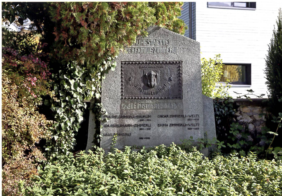
Die letzte Ruhestätte der Familie Zimmerli (siehe Seite 30).

Eine Arbeitsgruppe hat im Auftrag des Gemeinderates in verschiedenen Workshops Ideen zusammengetragen und Varianten geprüft. Unterschiedliche Nutzun-