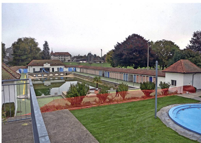
Das Freibad vor der Sanierung im Herbst 2020 ...

Sprungturm gedient hatte. In den folgenden Jahrzehnten erfolgten weitere kleinere Unterhalts- und Reparaturarbeiten, bis schliesslich rund 90 Jahre nach der Erbauung auf Beschluss der Aarburger Bevölkerung eine umfassende Sanierung anstand. Im Hinblick darauf beantragte die Gemeinde Aarburg, die sich der historischen und baukulturellen Bedeutung ihrer Badi wohl bewusst war, die kantonale Unterschutzstellung. Diese wurde im Februar 2022 rechtskräftig. Somit konnten die in Zusammenarbeit mit der Kantonalen Denkmalpflege geplanten Umbau- und Sanierungsarbeiten von der Epprecht Architekten AG, Aarburg (Architektur), und der Jenzer+Partner AG, Aarberg/Crissier (Schwimmbadtechnik), von Herbst 2021 bis Sommer 2022 durchgeführt werden. Die Ausführung der Arbeiten wurde eng von der Kantonalen Denkmalpflege begleitet. Der Kanton Aargau und die Eidgenossenschaft unterstützten die denkmalgerechte Sanierung finanziell. Als Grundsatz für die Baumassnahmen zur technischen Modernisierung galt, dass das Freibad sein ursprüngliches Erscheinungsbild bewahren respektive dieses möglichst wiederhergestellt werden sollte. So umfassten die Haupteingriffe die denkmalgerechte Restaurierung der originalen Bausubstanz, die Rekonstruktion der nicht mehr erhaltenen Bauteile gemäss Befund, die Neuerstellung des nicht mehr schutzfähigen Bassins, einen Neubau des Technikgebäudes, eine Neuorganisation der sanitären Einrichtungen innerhalb der