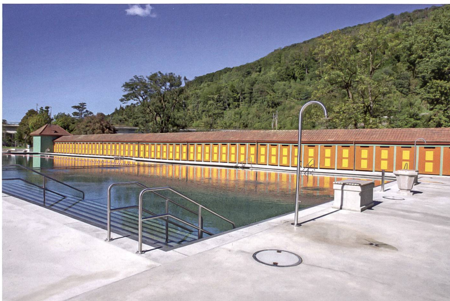
Blick gegen Westen zu den Umkleidekabinen mit den neuen Türen in bauzeitlicher Farblichkeit.

Eine der augenfälligsten Neuerungen ist die Wiederherstellung der bauzeitlichen Farblichkeit der Aarburger Badeanstalt. Im Rahmen der Sanierung konnten dank eines restauratorischen Farbuntersuchs die originalen Farben der verschiedenen Gebäudeteile festgestellt werden. Zum Vorschein kam eine bunte, kräftige Farbpalette, die für die Bauzeit durchaus typisch ist und sich bei zeitgleich entstandenen Bauten findet, so auch bei Freibädern im Stil des Neuen Bauens. In Aarburg ist die Farblichkeit subtil abgestuft: Während sie am Aussenbau eher gedämpft und zurückhaltend zu den umliegenden Bauten wirkt, leuchtet sie im