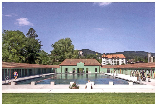
... und am Eröffnungstag. Noch sind die neuen Türen nicht montiert.