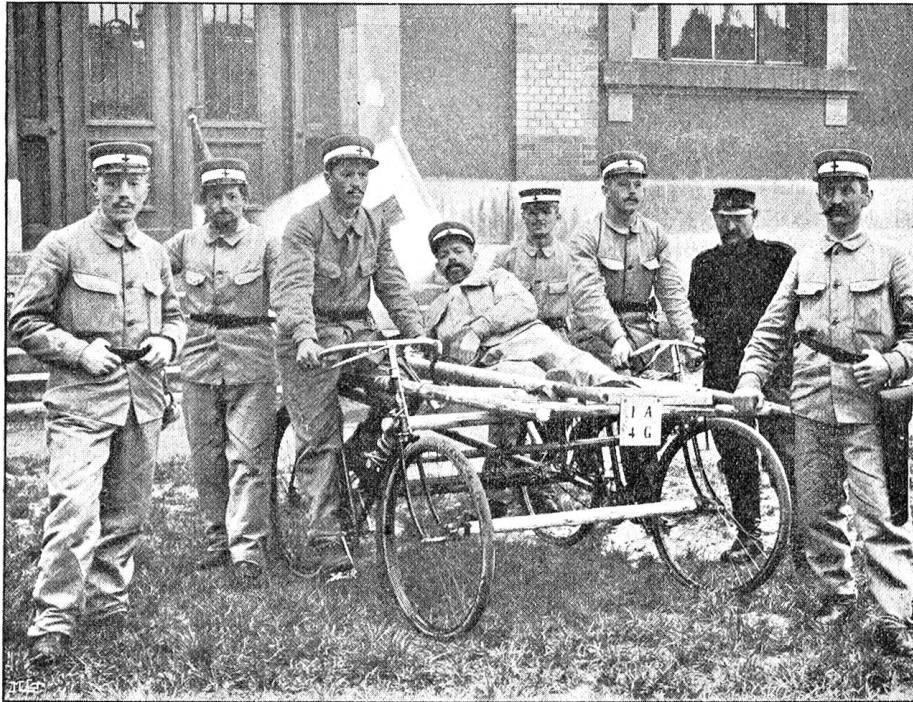
Improvisierte Fahrbahre, hergestellt aus zwei gewöhnlichen Velo.

100 Mann zählte. Für diesen Rückgang sind zweifellos mehrere Gründe vorhanden. Einmal ist die Bildung von Sanitätshilfskolonnen in der Schweiz erst im Anfang und die große Mehrzahl der Vereine hat sich noch nicht ernsthaft diesem wichtigen Gebiete gewidmet. Dann ist von verschiedenen Seiten geklagt worden, daß Leuten, die den Kurs mitzumachen beabsichtigt hatten, der nötige achttägige Urlaub vom Geschäft nicht erteilt wurde und schließlich ist es begreiflich, daß zahlreiche