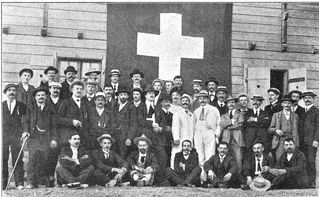
Bundesfeier in Reggio, 1. August 1909.

32 Wohnungen zu drei Zimmern, Küche, Veranda und Abort zu vergeben und nicht weniger als 260 Familien bewerben sich darum! Dabei werden alle irgendwie erreichbaren Einflüsse in Bewegung gesetzt und es macht sich das Temperament des Italieners sehr lebhaft geltend. Jeder erklärt sich selber für den Allercärmsten und Bedürftigsten und kann es nicht fassen, daß nicht er vor allen andern Berücksichtigung findet. Dabei muß gesagt werden, daß in all dem die Ubertreibung