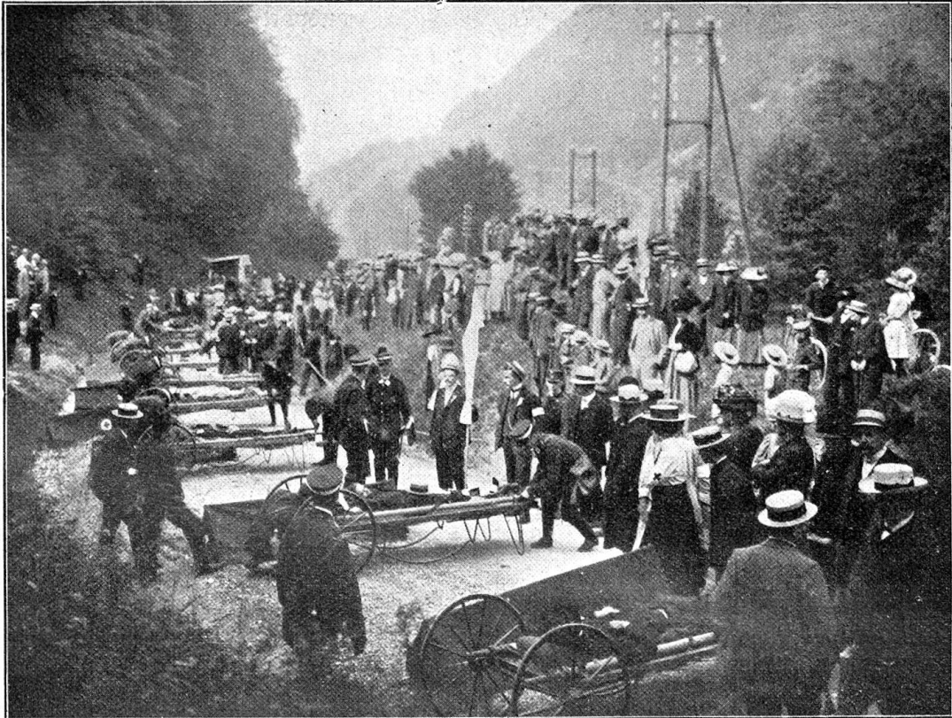
Vom bernischen Rot-Kreuz-Tag in Tavannes. — Die Sanitätshülfskolonne Biel mit den Räderbahren.

15 an der Zahl. 10 sitzend zu Transportierende fanden willkommene Unterkunft im nunmehr leer gewordenen Kolonnenfourgon. Ein hübsches Bild bot alsdann die Karawane, wie sie sich um 10 \frac{1}{2} Uhr die Straßenwindungen emporschlängelte (siehe Bild), voran das Auto des Generalstabschef Dr. Geering, dann der „Leichenzug“ der braunen Sargbahren, beziehungsweise der 10 mit braunem