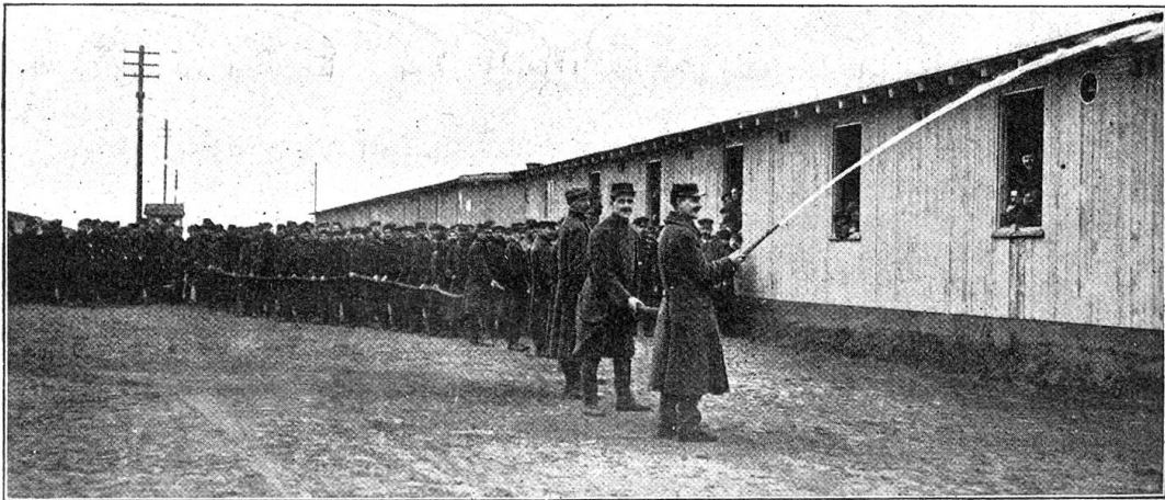
Aus den Gefangenenlagern Deutschlands. — Spritzenprobe.

etwas monoton aussehen, aber den hygienischen Anforderungen entsprechen sollen. Das zweite