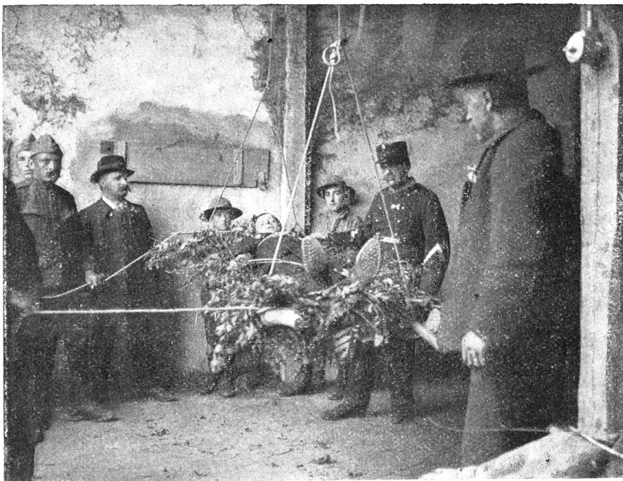
Militärjägersverein Zürich. — Aufzug eines Verwundeten.

Als erste Wettübung wurde die Konstruktion einer Tragbahre aus Naturholz bestimmt und zwar für alle 3 Gruppen gleichzeitig. Nach einem Zeitraum