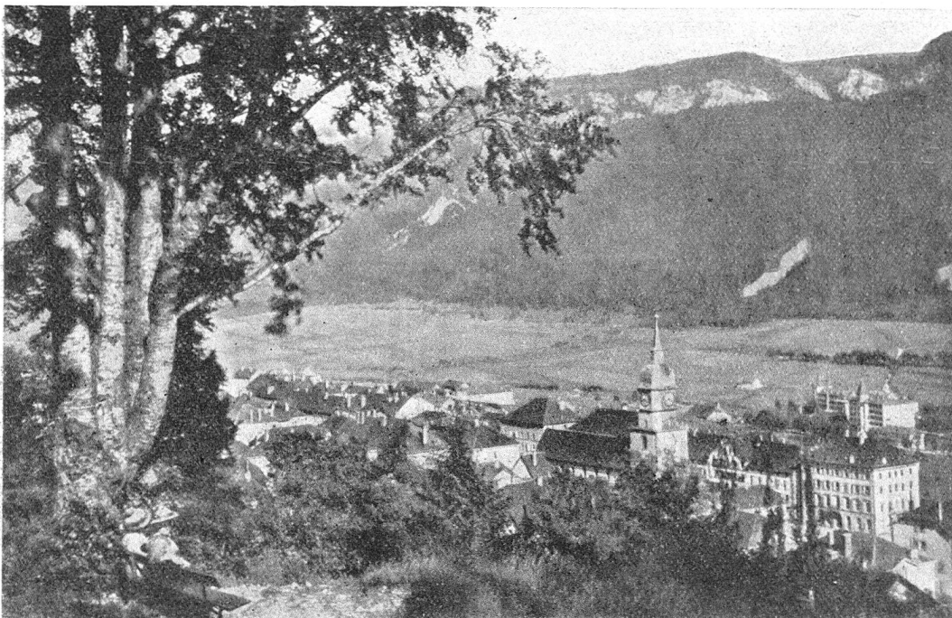
St-Imier et Mont-Soleil.