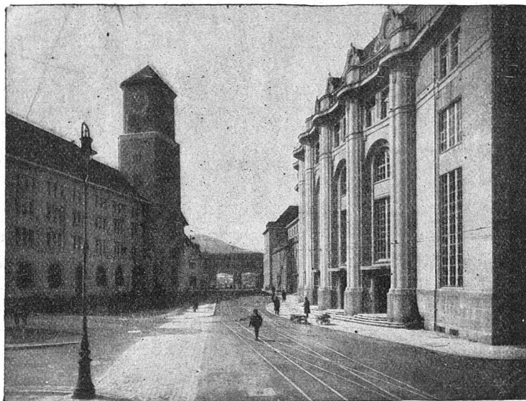
St. Gallen, Bahnhof.

Um 12 Uhr gemeinsames Mittagessen im großen Saal des Schützengartens. Nach dem Mittagessen: Ausflug nach dem Scheffelstein. Gemütliche Vereinigung und Vesper. Die