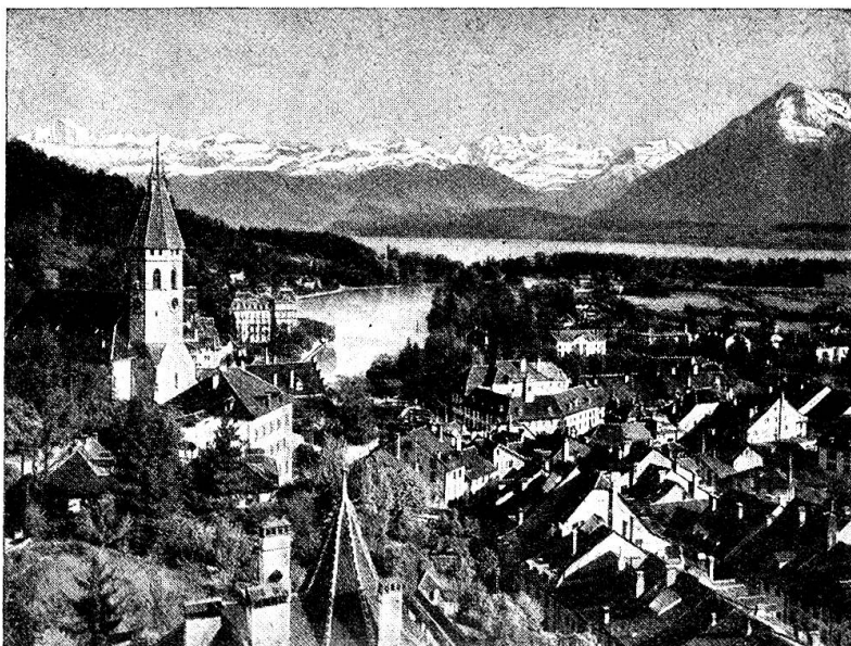
Thun, Ausicht auf See und Berge.

14.45 h.: Promenade sur le lac, par bateau spécial, offert par la section Oberland-Bernois. Départ du débarcadère « Kursaal ».