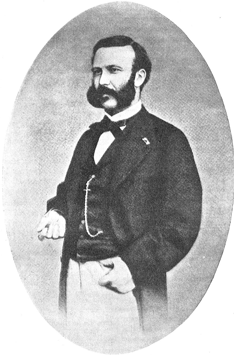
Dunant im Alter von 33 Jahren. - Dunant à l'âge de 33 ans.

pays. Il est en France, en Allemagne, à Berlin, à Paris, à Lyon, à Dresde, à Vienne..., mais tous ces déplacements, toutes ces démarches l'obligent à des dépenses considérables. D'autre part, les trop fréquentes absences de Dunant compromettent les entreprises industrielles et financières dans lesquelles il espérait trouver les ressources qui lui étaient