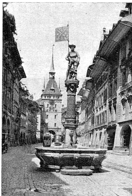
Une des nombreuses fontaines de la ville de Berne.

Wichtige Notiz. Zum Besuche der Expa sind die einfachen Billette zur Rückreise gültig, sofern sie in der Ausstellung zur Abstempelung vorgewiesen werden. Die Schnellzugzuschläge sind für die Hin- und für die Rückfahrt zu lösen. Weitere Fahrbegünstigungen werden auf Gesellschaftsbilletten gewährt. Alle weiteren Auskünfte hierüber sind bei den Bahnstationen erhältlich.