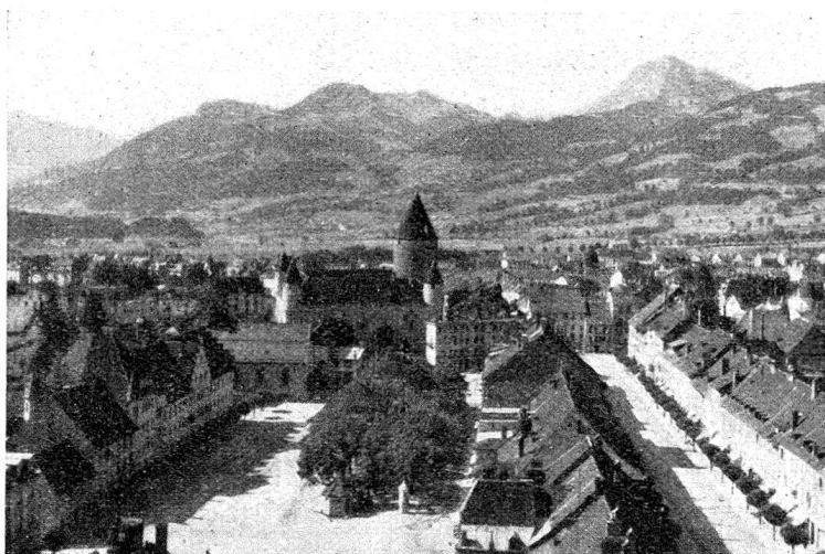
Der Marktplatz von Bulle mit Schloss und dem Moléson.

Bulle einer photographischen Aufnahme der Delegierten gewidmet. Hierauf gab Oberstkorpskommandant Wildbolz eine mit jugendlichem Feuer und aufrichtigstem Patriotismus wiedergegebene kurze Orientierung über die Tätigkeit der von ihm präsierten und vom Bundesrate eingesetzten Kommission zum Studium von Maßnahmen zum Schutze der Zivilbevölkerung gegen den chemischen Krieg. Der reiche Beifall, welcher den Worten des Referenten gezollt wurde, zeigte, daß unsere Delegierten bereit sind, alles zu tun, um