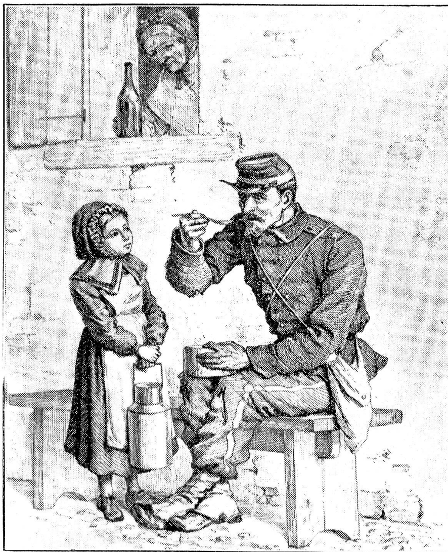
Accueil fraternel d'un soldat français, en 1871.

Gothard obstrué par l'hiver, notre vie régulière, celle des maisons d'école utilisées à d'autres buts, celle des temples et de nombreux de nos intérieurs fut lit-