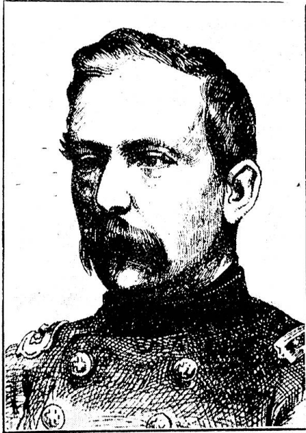
Le général Hans Herzog, 1819—1894, dont l'état-major était installé à l'hôtel de ville de Neuchâtel, en février 1871.

hostilités, l'occupation des frontières, l'on n'entend guère que par bribes parsemées d'anecdotes ce que fut l'entrée de l'armée de l'Est. Philippe Godet en parle dans ses «Souvenirs». Les trois