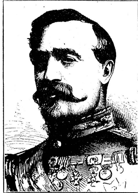
Le général Bourbaki, dont le commandement de l'armée de l'Est fut repris par Clinchant, en 1871.