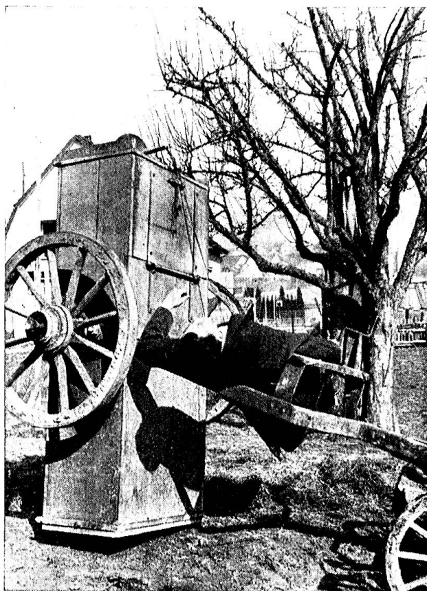
L'accident qui a rompu les reins au conducteur.

raboteuse; soudain sa main fut prise dans la machine, happée par la scie. Et la main de la fillette y resta.