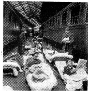
1. Die Schwerverwundeten auf dem Perron des Bahnhofes Cerbère. — Quelques grands blessés sur le quai de la gare de Cerbère.

Zuerst wurden alle Ankömmlinge vacciniert; auch die Schwestern vom spanischen Roten Kreuz halfen mit. Diese jungen, blitzsauberen Mädchen machten mir einen besonders guten Eindruck. Wir verbanden die verschiedensten Schusswunden in allen Stadien der Heilung.