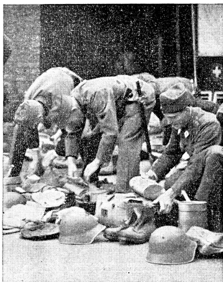
....und wie es dann in Wirklichkeit war.