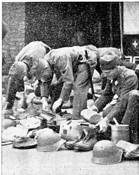
....und wie es dann in Wirklichkeit war.