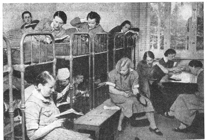
Lotta-Svärd-Verein: Vor dem Schlafengehen.