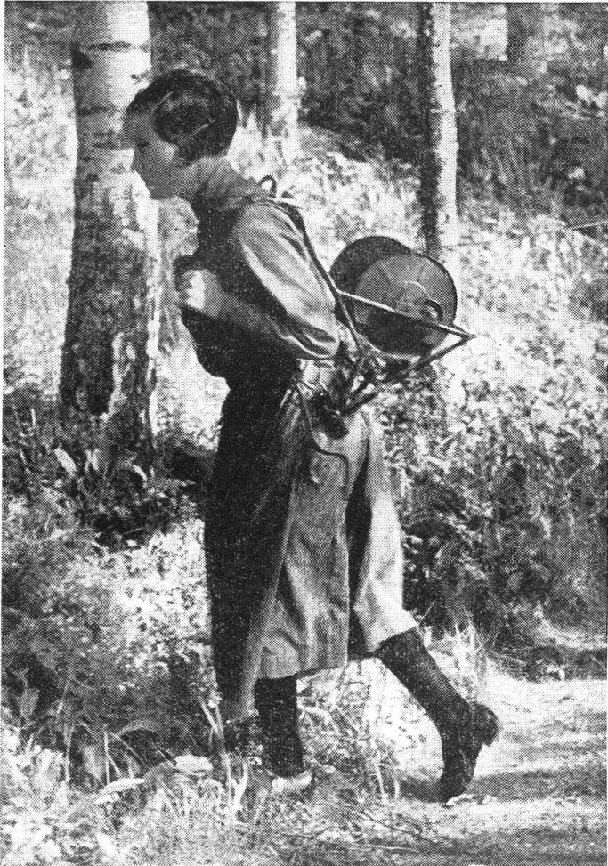
Lotta-Svärd-Verein: Ziehen von Feldleitungen.

Wetzikon. S.-V. Schlussprüfung des Samariterkurses: Samstag, 16. Dezember, 19 Uhr, im Hotel «Löwen», Ober-Wetzikon. Für alle Aktivmitglieder obligatorisch. Anschliessend einfaches Nachtessen zu Fr. 1.50 sowie gemütlicher 2. Teil (froher Samariterhock mit Musik und Einlagen). Wir erwarten alle. Unsere Nachbarsektionen laden wir auf diesem Wege ebenfalls freundlich ein.