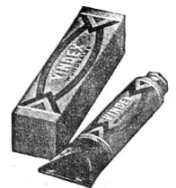
Vindex-Wundsalbe in Tube

„FLAWA“, Schweizer Verbandstoff- u. Wattefabriken AG., Flawil