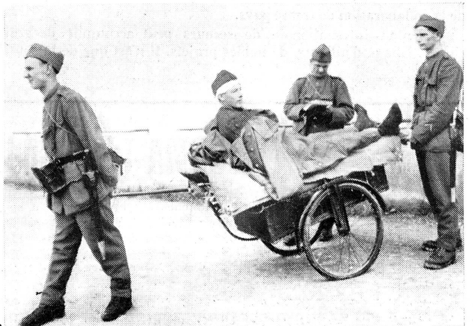
Für Verwundeten transport eingerichteter Fahrradanhänger.