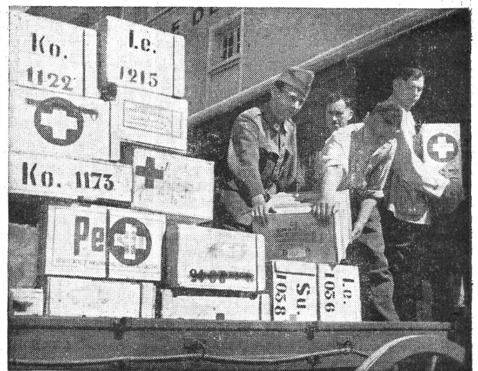
Am Bahnhof von Bulle. Eine erste Sendung der für die Flüchtlinge und Kriegsofper gesammelten Naturalgaben wird verladen. Bestimmungsort: Toulouse. — A la gare de Bulle. On charge un premier envoi de dons en nature récoltés pour les réfugiés et victimes de la guerre. Destination: Toulouse. (Zensur Nr. III 1974 He.)