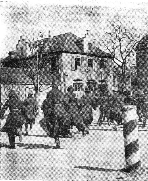
Kaderkurs für Rotkreuzfahrerinnen. 11.—21. März. — Antreten!

Vite, il fallait encore se porter au secours des hommes qui, ici et là, avaient bien voulu se faire blesser, non panser, dans les règles, pour donner l'occasion à certaines d'entre nous de mettre en pratique les excellents enseignements de notre lieutenant-médecin. Ils ont été transportés sur des brancards dans les autos et déposés dans un hôpital militaire. Quatre par quatre, nous avons été appelées à descendre, puis