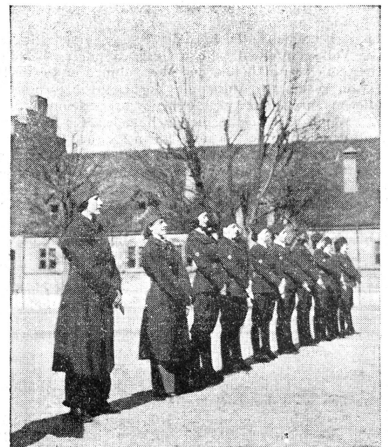
Kaderkurs für Rotkreuzfahrerinnen. 11.—21. März. — Rotkreuzfahrerinnen! Achtung!