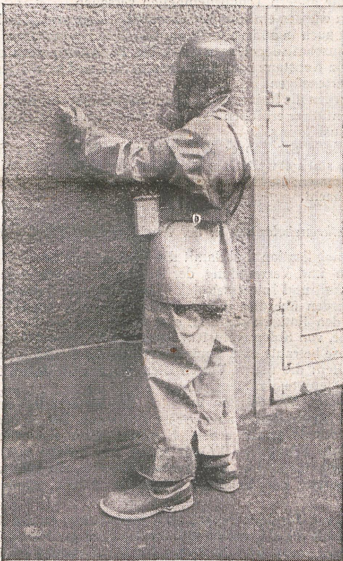
Gasschutzübung der Rotkreuzkolonne Zürich, 21. Oktober 1934. «Gasspürer». — Exercice de protection contre les gaz dans la colonne de Croix-Rouge à Zurich, le 21 octobre 1934.

Rotkreuzchefarzt - Médecin en chef de la Croix-Rouge - Medico in capo della Croce-Rossa