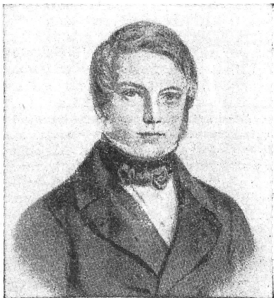
Der Zürcher Arzt Conrad Meyer-Hoffmeister (1807—1881), der sich im Sonderbundskrieg grosse Verdienste um die Organisation der Verwundenpflege erwarb. Er war die Seele des «Vereins der Stadt Zürich zum Transport von schwer verwundeten Militärs». — Le médecin zurichois Johann Conrad Meyer-Hoffmeister (1807—1881) qui s'est acquis un grand mérite, pendant la guerre du Sonderbund, par l'organisation des soins à donner aux blessés. Il était l'âme de l'Association de la ville de Zurich pour le transport des grands blessés de guerre.

Eine für die Kolonnen und das Schweiz. Rote Kreuz ausserordentlich wichtige Entscheidung stellte der Beschluss des Bundesrates vom 28. Oktober 1938 dar, durch welchen dem Eidg. Militärdepartement für die materielle Ausrüstung der Rotkreuzkolonnen ein Kredit von Fr.