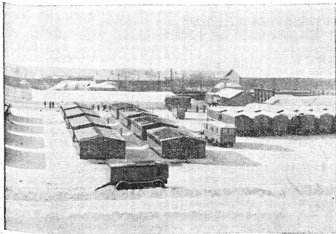
Bereitschaftslazarett des deutschen Roten Kreuzes. - Teilansicht des motorisierten Feldlazarettes

(Angaben und Bilder aus dem «Nachrichtendienst der Liga der Rotkreuzgesellschaften» und aus der Zeitschrift «Das Deutsche Rote Kreuz».)