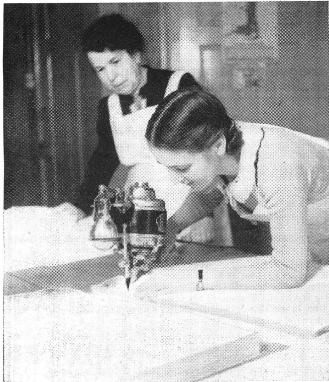
Ein Schneideratelier hat dem Zweigverein vom Roten Kreuz, Olten, eine Zugschneidemaschine zur Verfügung gestellt. Dank dieser Maschine und der grossen Schicklichkeit der Frauen vom Zweigverein ist es möglich, bis zu 105 Wäschestücke auf einmal zu schneiden.