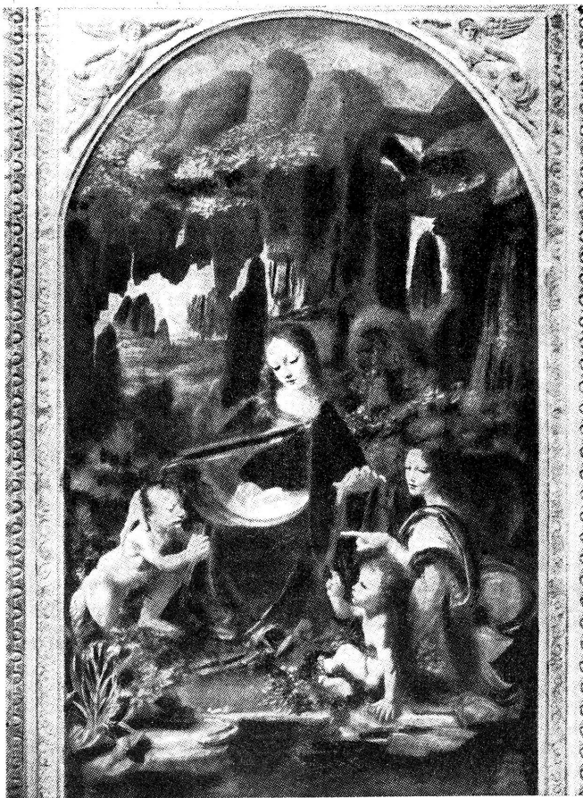
Leonardo da Vinci: Madonna in der Felsgrotte