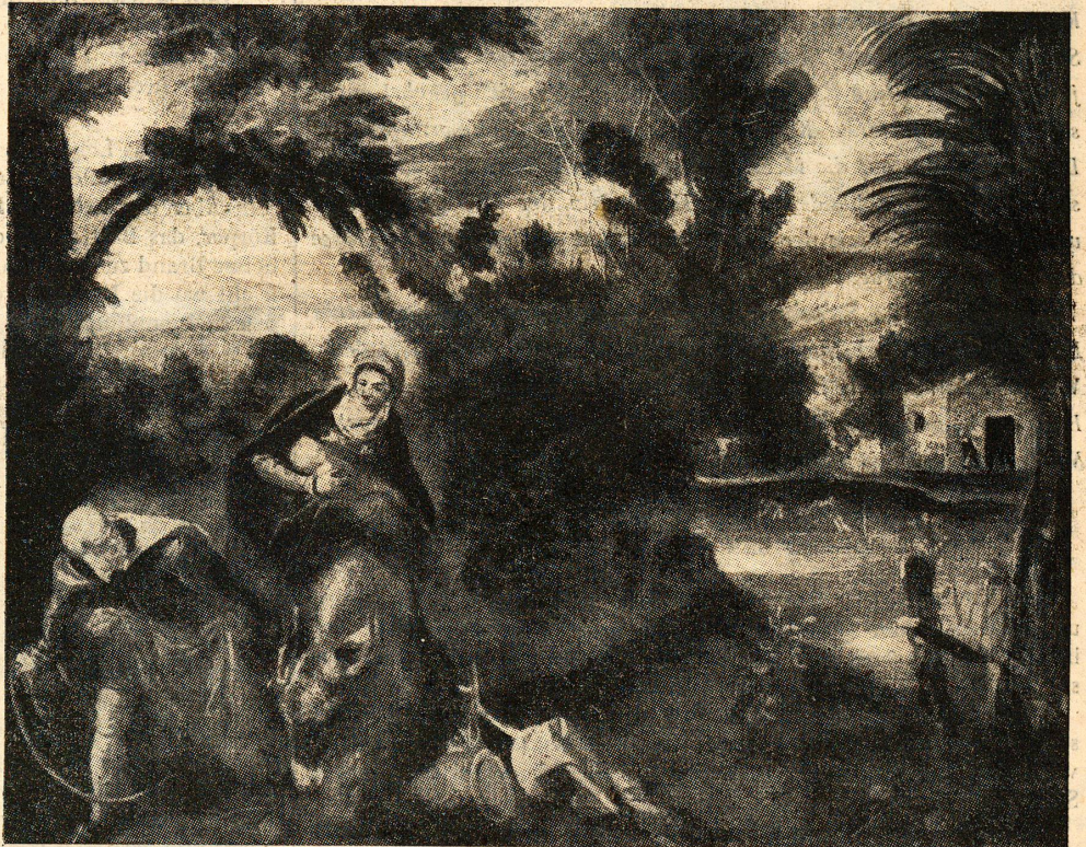
Tintoretto: Die Flucht nach Aegypten

ora anch'io ti voglio dar l'anima mia che d'esser teco ognor tanto desia.