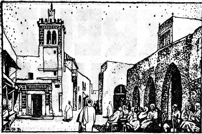
Moschee von Sidi-Mansour

in Tunis. — Mosquée de Sidi-Mansour, Tunis.