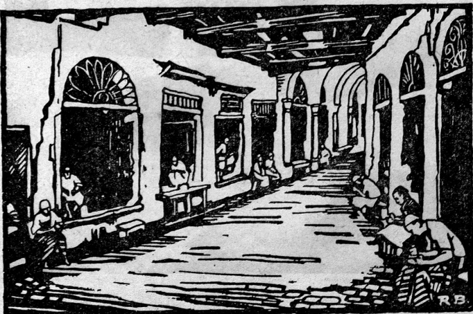
Die Souks von Tunis - Tunis, les Souks

Vor uns liegt das Feld von Karthago. Einsam steht darauf die Kathedrale.