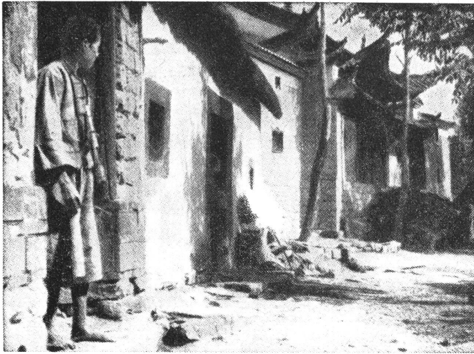
Sonniges Gässchen bei Ileang Ruelle ensoleillée près d'Ileang

10 cent. — la medesima usata finora nella colletta settimanale, ma in altra tinta — in favore dei bambini vittime della guerra. Si capisce che non si tratta affatto d'un obbligo e ognuno è libero di rifiutare l'acquisto.