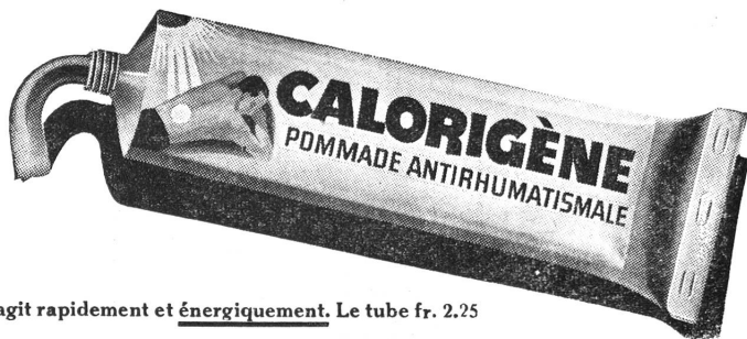
agit rapidement et énergiquement. Le tube fr. 2.25

Basel, Klein-Basel. S.-V. Mi., 27. Okt., 20.00 im Rest. «Greifen» (Greifengasse): Lichtbildervortrag von E. Th. Spiess über: Erinnerungen an eine Sizilienreise. Mitglieder mit ihren Angehörigen sind freundlich eingeladen. Ende Oktober werden die noch ausstehenden