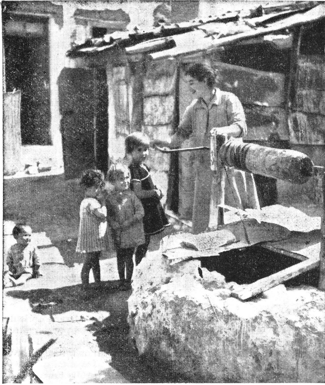
Mission des Schweizerischen Roten Kreuzes, Kinderhilfe in Griechenland. Hof des alten Milchzentrums Pangrati in Athen.