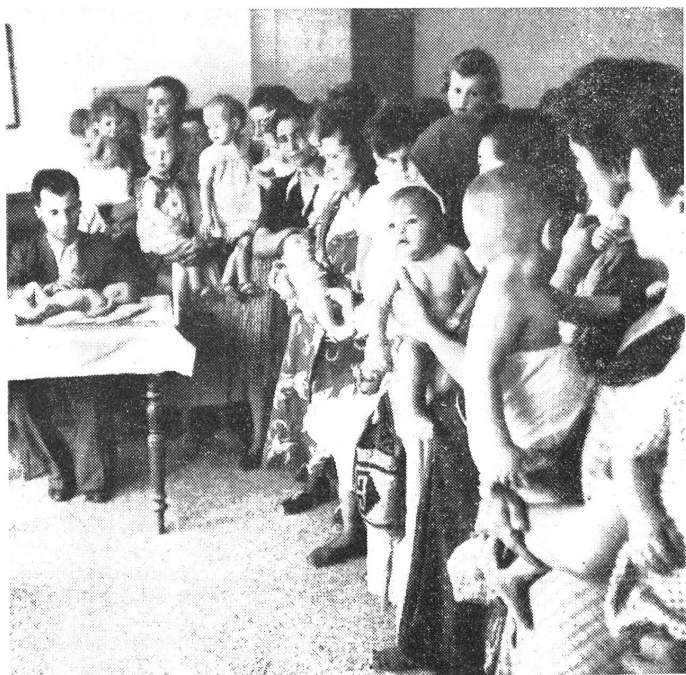
Aerztliche Untersuchung in einem der vielen Zentren Visite hebdomadaire du docteur

Unsere Mission erachtete es als wichtig, einen ärztlichen Dienst unmittelbar in den Milchverteilungscentren, wo die Kinder täglich zusammenströmen, einzurichten. Aus Mangel an allem stellten sich diesem Dienst zuerst grosse Schwierigkeiten entgegen. Nach Ankunft grösserer Milch- und Medikamentenmengen aus Kanada jedoch konnten den Aerzten die notwendigen Mittel zur Pflege und Stärkung der Kinder zur Verfügung gestellt werden.