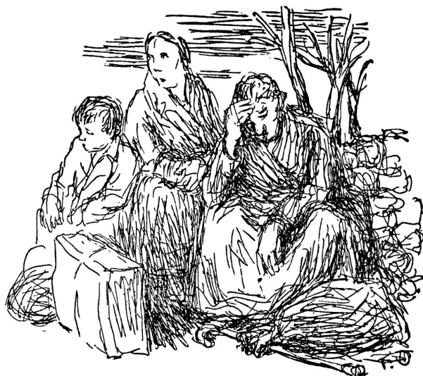
Rast der Flüchtlinge - Des réfugiés se reposent *)

*) Die beiden Bilder dieser Seite stammen von der Schweizerischen Zentralstelle für Flüchtlingshilfe.