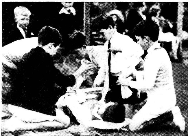
Australien: Unterricht in erster Hilfe Australie: Enseignements de premiers secours