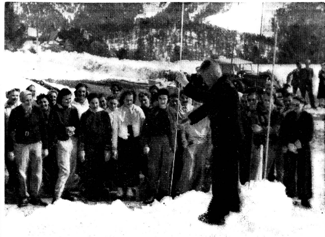
Die Mitglieder eines Samaritervereins im Gebirge erhalten Unterricht im Sondieren von Lawinen.

Descente en corde d'un brancard improvisé. En arrivant au bas du rocher, la blessée déclarait: «J'avais un sentiment de sûreté absolue.»