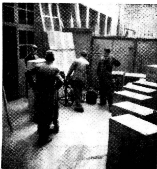
Maurer- und Zimmermannskisten mit den entsprechenden Assortimenten werden in Bern zusammengestellt und verladebereit gemacht.