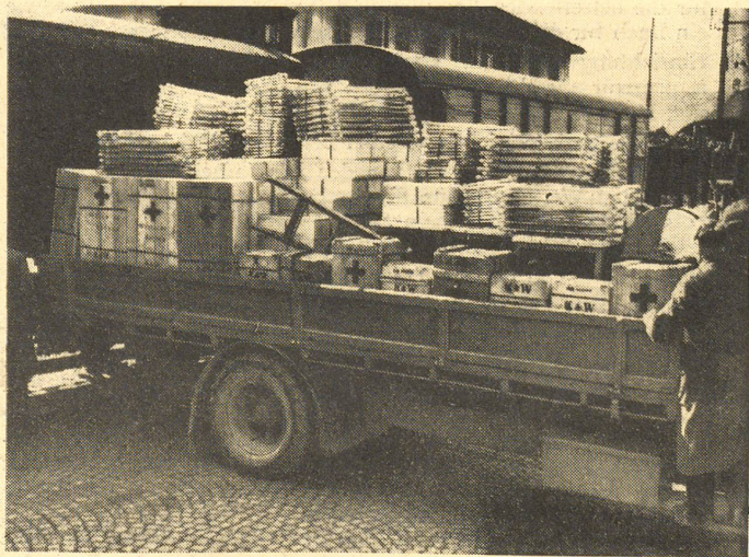
Bahnhof Bern: Bahnverlad der Werkzeuge und Kisten.

Contenu d'une des 200 caisses individuelles destinées aux sinistrés du Vercors.