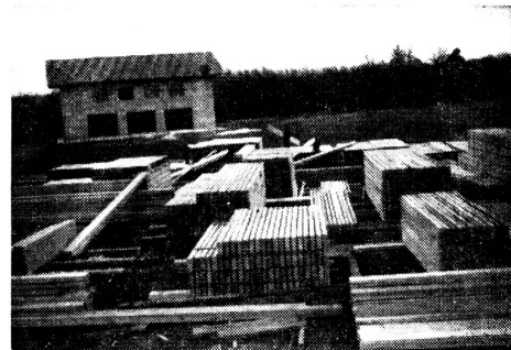
Das von der Schweizer Spende zur Verfügung gestellte Bauholz wird in St-Hilaire-du-Rosier (Isère) abgeladen und gelagert.

Von Anfang an war vorgesehen, die Hilfsaktion für den Vercors zeitlich in zwei Abschnitten durchzuführen. Die erste Teilaktion, die eben beendet worden ist, hat die Einrichtung von fünf Werkplätzen und den Versand von 800 m 3 Bauholz sowie 2540 m 2 Dachpappe erlaubt. 200 Einzelwerkzeugkisten ergänzen dieses erste Unternehmen. Sie sind den Empfängern zusammen mit einer Botschaft des Schweizervolkes ausgehändigt worden. In der Botschaft wird zum Aus-