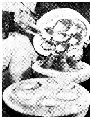
Die angesaugte Tonkruste ist dick und fest genug geworden, um die Gipsform öffnen und die Beckeli herauschälen zu können.

Kauft deshalb am 5. Mai ein Beckeli, füllt es mit Geldstücken — in diesem Jahr geht auch ein Einfrankenstück hinein — und bringt das gefüllte Beckeli zur Kinderhilfe zurück!