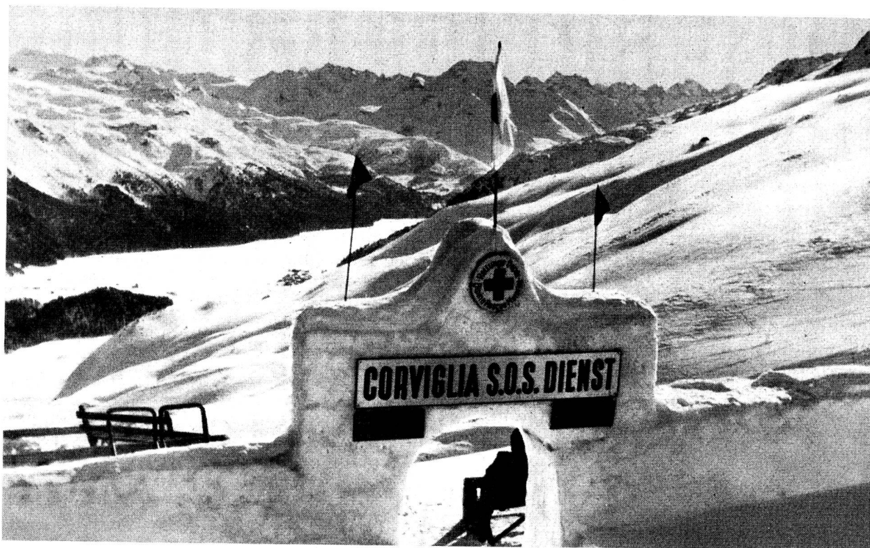
SOS-Zentrale an einer obern Drahtseilbahnstation.

Ausnahme eines olympischen Pistolenschusses (Fünfkampf) aus einer schwedischen Pistole in das Knie eines Bündner Kantonspolizisten passierten die wenigen schweren Unfälle ausschliesslich bei den Skiwettkämpfen (Bob, Skeleton, Eis- und Militärettkämpfe inbegriffen).